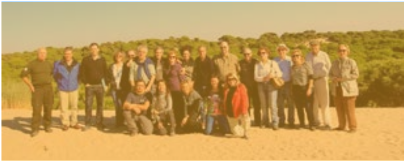
Grupo 20 años de Europarc en Doñana

P: Hace unos meses Europarc-España cumplió 20 años. La exitosa trayectoria de la institución y el reconocimiento de buena parte de vuestras iniciativas (congreso, master, publicaciones, redes de trabajo, etc.) son evidentes. En este contexto, ¿cuáles son los objetivos y prioridades actuales de la asociación?