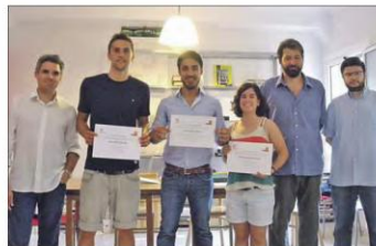
Los galardonados, con representantes del Colegio de Geógrafos.

El calor nocturno La isla de calor dificulta moderar las temperaturas por la noche. Este fenómeno se produce por una serie de factores, que son los urbanísticos, meteorológicos, topográficos y la influencia del mar. En cuanto a los primeros, "en función de la tipología de las edificaciones (material, altura...),