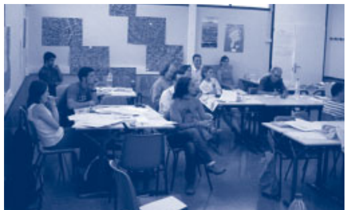
Sesión de taller: presentación de las conclusiones de cada grupo de trabajo.

Asistieron una veintena de personas, entre estudiantes de las licenciaturas de geografía, ciencias ambientales, economía o arquitectura y becarios de investigación de varias universidades españolas, técnicos municipales, entre otros profesionales.